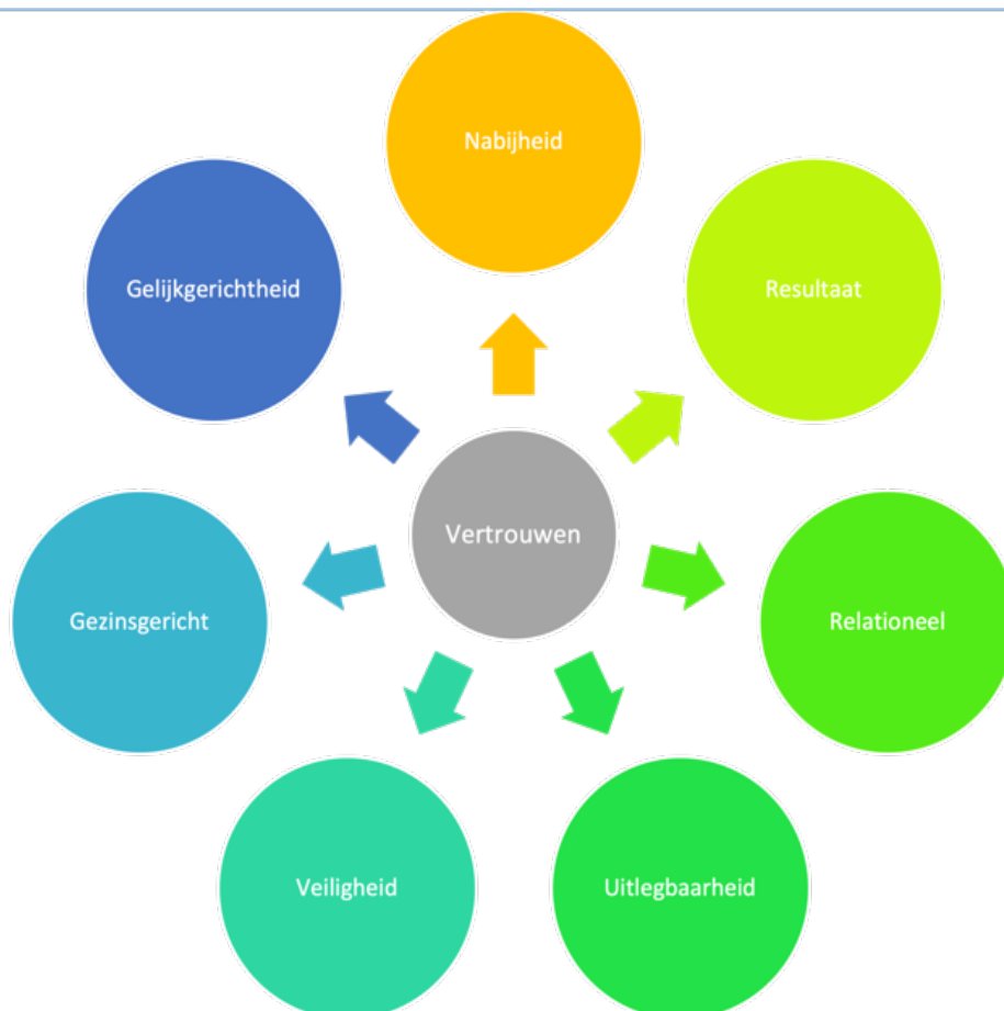
Figuur 1 – waarden onderliggend aan de transformatie "Thuis voor Noordje"

In 2020 hebben we vastgesteld vanuit welke waarden we willen werken en welke gedragsprincipes en oplossingsrichtingen nodig zijn om te kunnen werken aan een "Thuis voor Noordje" voor alle jeugdigen in Noord-Holland: